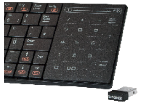
Nano Receiver im Lieferumfang enthalten