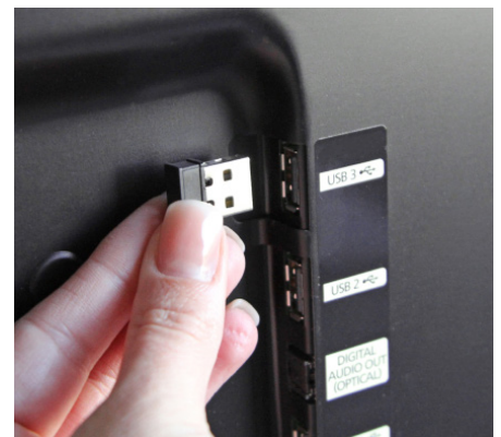
An einen USB-Anschluss anschließen